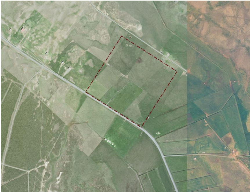
Mynd 1. Deiliskipulagssvæðið og skráðar fornminjar innan jarðarinnar Hnjúka við Blönduós.

Deiliskipulag þetta nær yfir um 15 ha svæði sem skilgreint er sem athafna- og iðnaðarsvæði, Hnjúkar (A1/I2) í aðalskipulagi Blönduósbæjar 2010-2030. Svínvetningabraut liggur sunnan við svæðið.