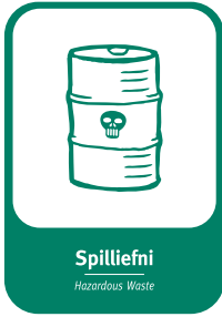
Spilliefni Hazardous Waste